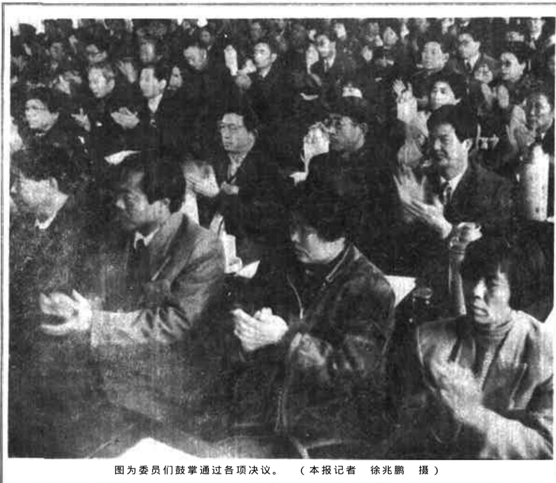
图为委员们鼓掌通过各项决议。

本报讯 (记者 王海林)历时6天的中国人民政治协商会议第三届东营市委员会第三次会议，圆满完成各项议程，于3月4日上午在天河宾馆胜利闭幕。